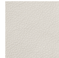
V63 / V73