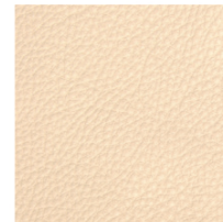
V62 / V72