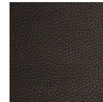
V67 / V77