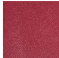
V61 / V71