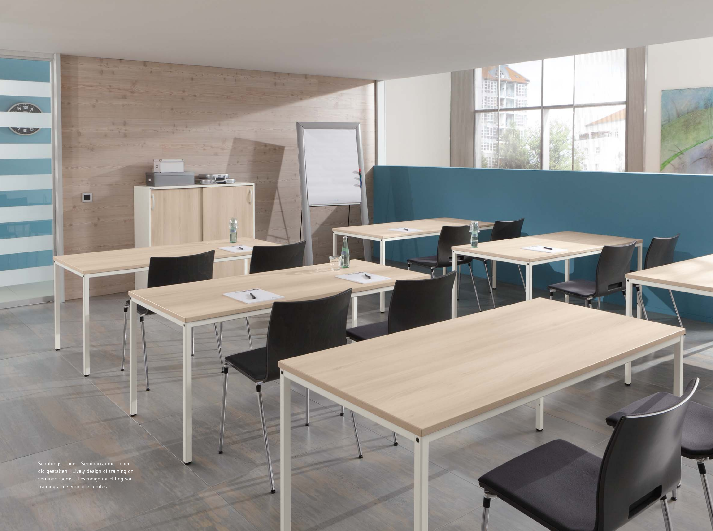
Schulungs- oder Seminarräume lebendig gestalten | Lively design of training or seminar rooms | Levendige inrichting van trainings- of seminarieruimtes